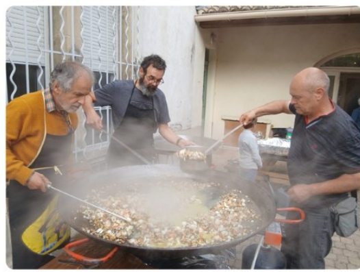
Les cuistots en action !

Que ces instants simples et chaleureux continuent de fortifier les liens qui nous unissent dans la foi et dans la joie du Christ.